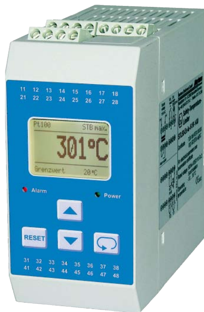
Bild 1: Der SIL2-Level ist Standard beim Sicherheits-Temperaturbegrenzer STL50-Ex

Beim Explosionsschutz geht es um Leib und Leben von Bediener und Anlage. Doch nicht alle explosionsgefährdeten Bereiche weisen die gleiche Gefährdung auf. Um die Häufigkeit und die Dauer zu kennzeichnen, mit der eine gefährliche explosionsfähige Atmosphäre auftritt, werden explosionsgefährdete Bereiche in Zonen eingeteilt. Mit Kenntnis dieser Zonen kann eine Gefährdungsbeurteilung getroffen und die Anforderungen für die Bereitstellung und Nutzung der Arbeitsmittel festgelegt werden. Im Schwerpunkt unterscheidet man zwischen Gasexplosionsgefährdeten und Staubexplosionsgefährdeten Bereich. Alle Geräte, wie Sensoren, Anzeigen und andere Geräte, müssen entsprechend dieser Zone eine Zulassung haben um entsprechend eingesetzt werden zu können. Der übliche Weg, um einen Temperatursensor in einer Ex-Zone einzusetzen, führt über einen Messumformer mit entsprechend eigensicherem Eingang. Der Eingang muss passend zu Zone zugelassen und geprüft sein. Dies bestätigt eine entsprechende Zulassung mit Zulassungsnummer des Geräte und namentlich erwähntem Hersteller. Diese Kombination gewährleistet, dass die zugeführte Energie ausreichend gering ist, um eine Explosion zu verhindern. Der letzte offene Punkt ist die erforderliche Zulassung des Fühlers. Hier gibt es zwei Argumentationen für und gegen eine Zulassung von Temperaturfühler. Betrachtet man den Temperaturfühler als passives Bauteil, erscheint eine Zulassung wenig verständlich, da die zugeführte Energie ausschließlich von den