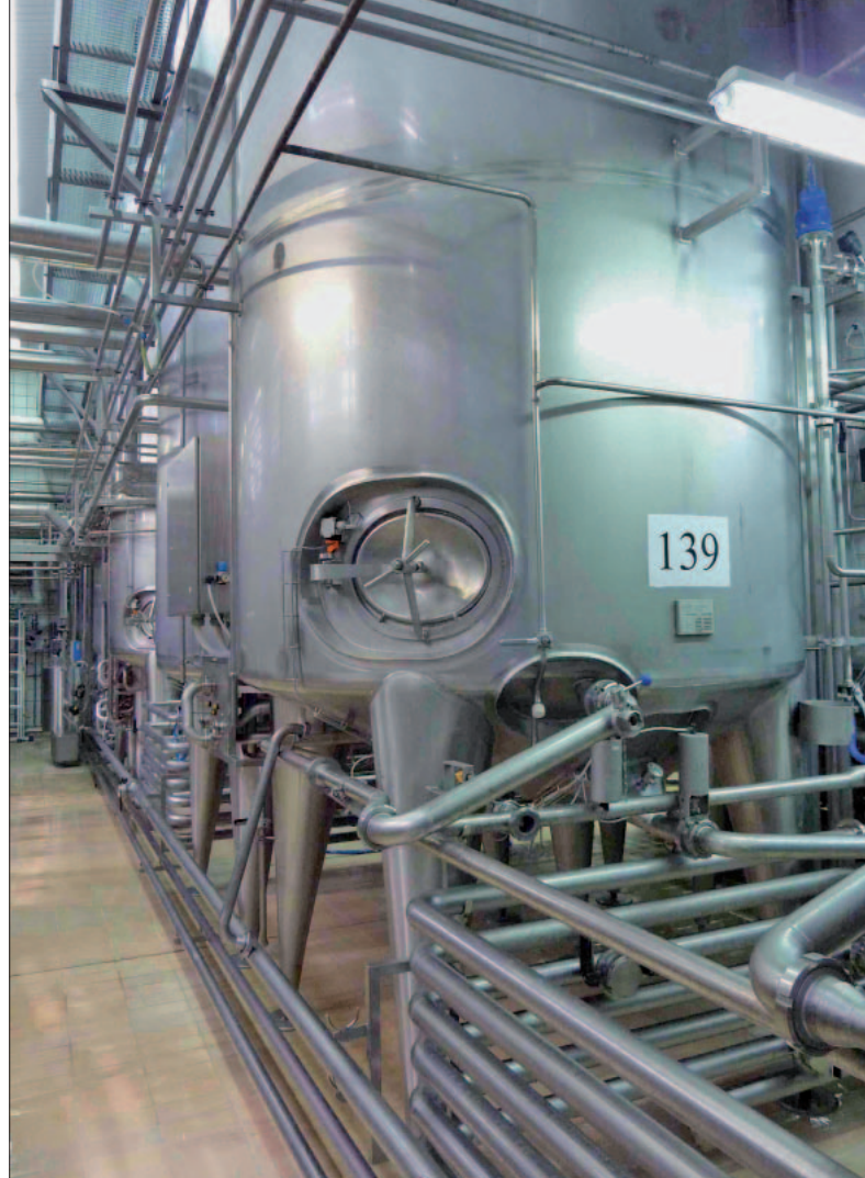
Abb. 8: In der Getränke- und Lebensmittelindustrie gibt es für die Grenzstand- und Durchflussüberwachung in Tanks und Rohrleitungen zahlreiche Einsatzmöglichkeiten für hygienische Sensoren.