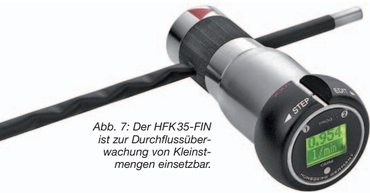
Abb. 7: Der HFK35-FIN ist zur Durchflussüberwachung von Kleinstmengen einsetzbar.