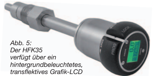
Abb. 5: Der HFK35 verfügt über ein hintergrundbeleuchtetes, transflektives Grafik-LCD