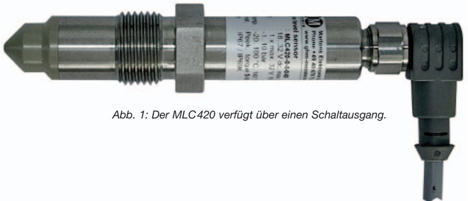
Abb. 1: Der MLC420 verfügt über einen Schaltausgang.

Schwankende, instabile Messwerte, die durch die Induktivität des Schwingkreises verursacht werden, gehören somit der Vergangenheit an.