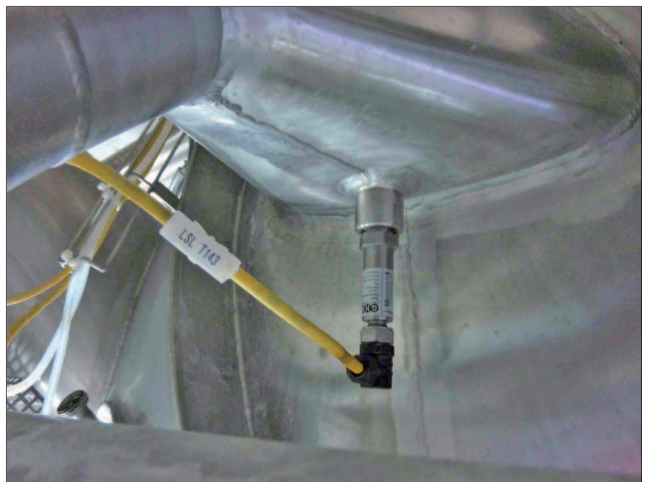
Abb. 6: Kapazitiver Grenzstandmelder MLC420 als Leermelder im konischen Auslauf eines Tanks.