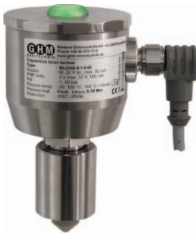
Abb. 2: Zwei Schaltausgänge sowie eine Weitsicht-LED im Gehäusedeckel bietet der MLC430.