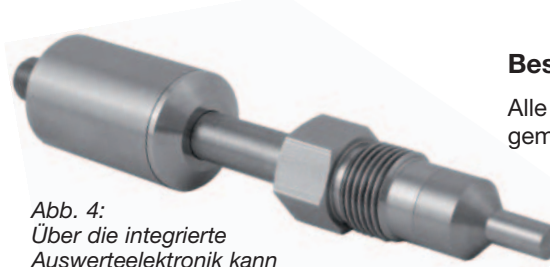
Abb. 4: Über die integrierte Auswertelektronik kann der HFK30 mit Schaltausgang und mit Analogausgang betrieben werden.

integrierte Auswertelektronik können diese Sensoren mit Schaltausgang und mit Analogausgang betrieben werden.